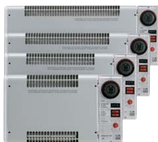
Serie Microrapid V0