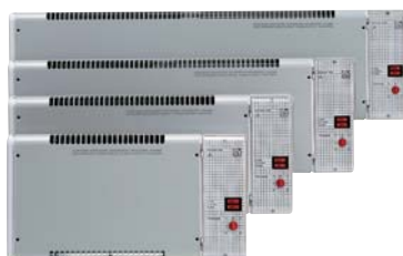
Serie Microsol V0