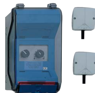
Vort Delta T° inklusive Decken- und Bodensensor

Vort Delta T° ist mit einem Wahlschalter für Ein / Aus / Automatik ausgestattet, die gewünschte minimal und maximal Drehzahl der Deckenfächer ist ebenfalls einstellbar.