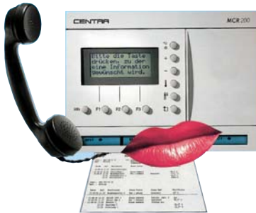
MCR 200 - Das ausbaufähige Regelsystem