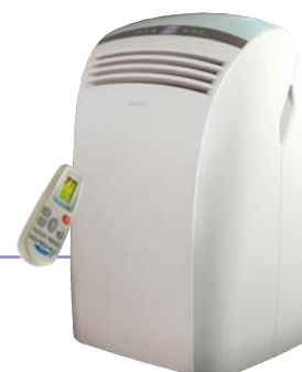
Dolceclima Silent 11 A+