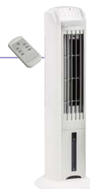
Peler 4 HEINISCH