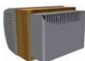
Wine C25 & C25S Außenansicht