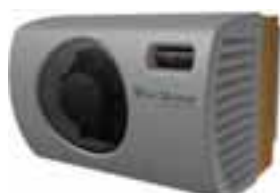
Wine C25 & C25S Innenansicht