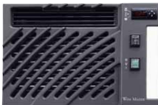
Wine C50S Innenansicht