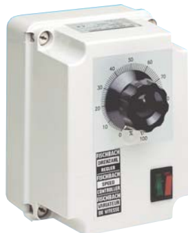
FDR80, stufenlos 230V