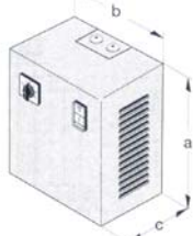
FDR5,5/3, 5-stufig 3 x 400V