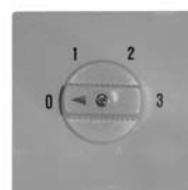
HM 487 UP