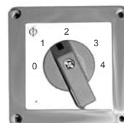
C10 .. AP