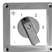
HM 486 AP