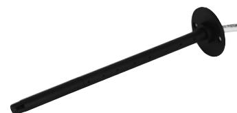
TG-K330 und TG-K360

TG-K330 TG-K360 Art. Nr. 227 103 728 227 103 733 Temperaturbereich: 0..30°C 0..60°C