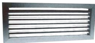
20-45-H & 21-45-H