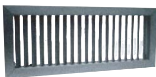
20-45-V & 21-45-V