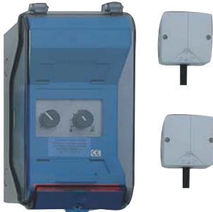
Vort Delta T° inklusive Decken- und Bodensensor

Vort Delta T° findet überall dort seine Anwendung wo eine hohe Temperaturdifferenz zwischen Boden und Decke herrscht und Durchmischung der Luft gewünscht wird.