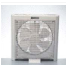
Besonders leicht zu positionieren

Der spiralenförmige Luftstrom sorgt für den optimalen Komfort. Wenn die Gitteroszillation eingeschaltet ist, bewegt sich das Gitter nach rechts, links, oben und unten ohne das sich der Ventilator bewegt. Ist der Ventilator in der "Fix-Stellung" strömt die Luft nur in die Richtung in die er zeigt.