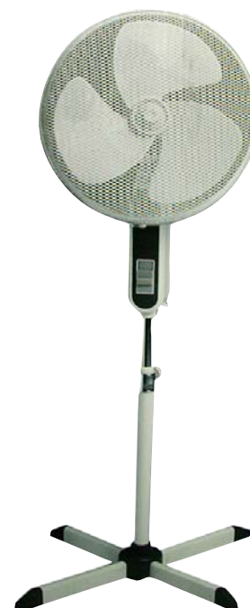
VE 400 ST