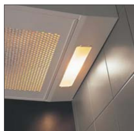
Sehr gute Ausleuchtung des Kochfeldes durch die im Gerät eingebauten Leuchten