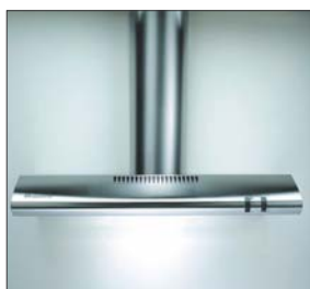
Installation zur Abfuhr der Abluft ins Freie Anschlussadapter für DN100 und DN125 inklusive