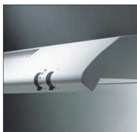
Bedienfeld mit Drehzahlschalter und Licht