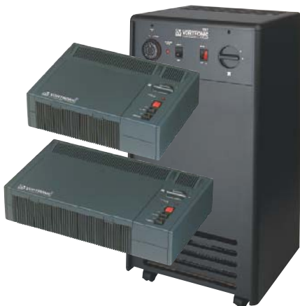
Vortronic 35FR, Vortronic 70FR, Vortronic 150TFR