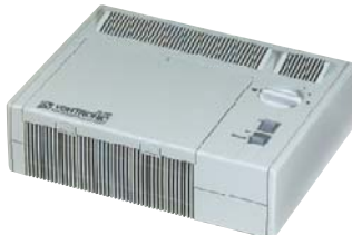
Vortronic 35 RF