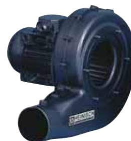
VM 160 und VT 160