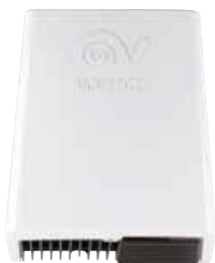
Premium Dry A