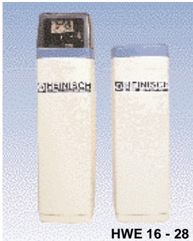
HWE 16 - 28

für Haushalt, Wohnhäuser, Gewerbe und Industrie