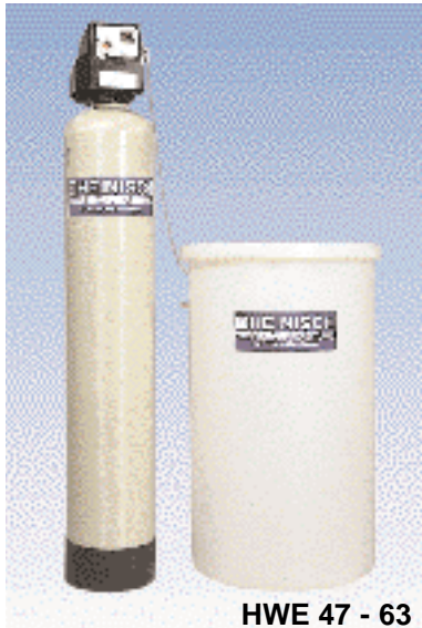
HWE 47 - 63

Die Verschneideeinrichtung ist im Steuerkopf eingebaut